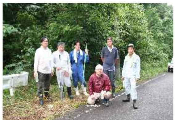
作業終了後の交流会