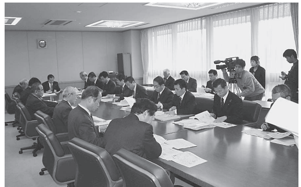
ごみゼロおおいた作戦実施本部

ごみゼロおおいた作戦は、昨年10月に策定した大分県長期総合計画「安心・活力・発展プラン2005—ともに築こう大分の未来—」の中でも、分野横断的に集中的・重点的に取り組む8つの重点戦略の一つである「豊かな天然自然 磨き輝き戦略」に位置づけられ、これまで以上に取組を強化していくこととなった。今後は、この大分県長期総合計画の環境側面における部門計画として策定された「大分県新環境基本計画—ごみゼロおおいた推進基本プラン—」に基づき、各般の環境施策を着実に推進することによって、『天然自然が輝く 恵み豊かで美しく快適なおおいた』の実現を目指すこととしている。（ごみゼロおおいた作戦の概念図は次の図2-1を参照）