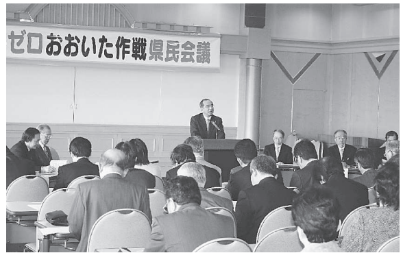
ごみゼロおおいた作戦県民会議

また、県庁内には、各部に跨る環境行政全般を一体的・総合的に推進するため、知事を本部長とする「ごみゼロおおいた作戦実施本部」を設置し、県民会議と緊密に連携しながら各般の環境施策を推進している。