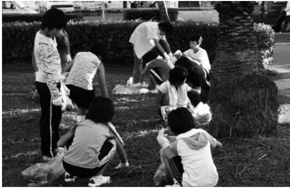
121万人県民一斉ごみゼロ大行動(豊後高田市)