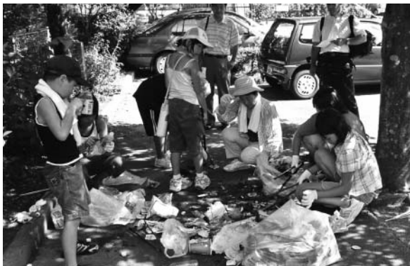
「ごみ度」と「きれい度」調査

また、空き缶や海のごみなどの「ごみ」から「ごみゼロアート・リサイクル作品」を製作、展示会を開催して身近な環境への関心を喚起した。