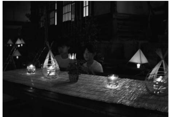
121万人夏の夜の大作戦(別府市)

平成17年度には前年度を大きく上回る1,154施設もの参加登録があったほか、大分市中心部では屋外看板の多くが消灯。別府市ではキャンドルでライトアップされた竹瓦温泉で留学生による二胡の演奏会が実施されるなど、各地で特色ある取組が展開された。