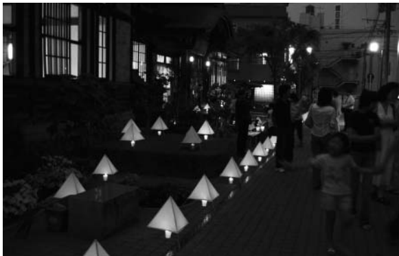
121万人夏の夜の大作戦(別府市)

夏至の日の20時から22時までの2時間、家庭や事業所の不要な照明や屋外看板を消すなどして省エネと地球温暖化対策に取り組む「121万人夏の夜の大作戦(キャンドルナイト)」を実施している。