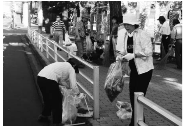
121万人県民一斉ごみゼロ大行動(大分市)

平成17年度は環境美化の日を8月7日に設定して、美化活動の実施を呼びかけたところ、県下で約22万人の県民が参加し、1,045トンものごみが収集された。