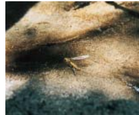
産卵中のキイロホソガガンボ