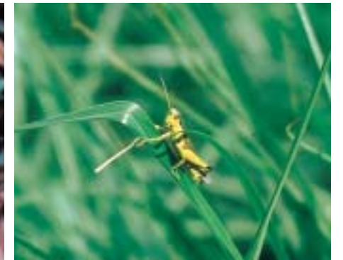
草原の主イナゴモドキ