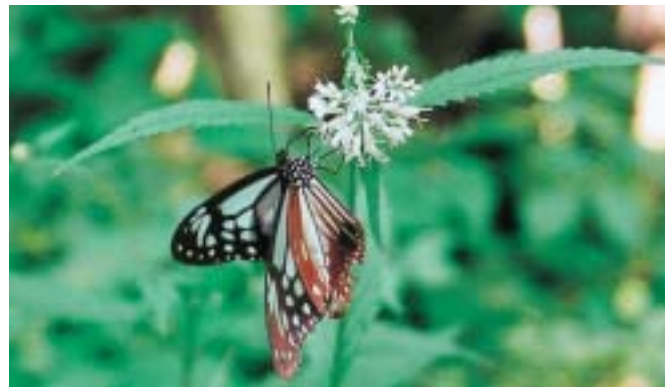
林辺のアサギマダラ