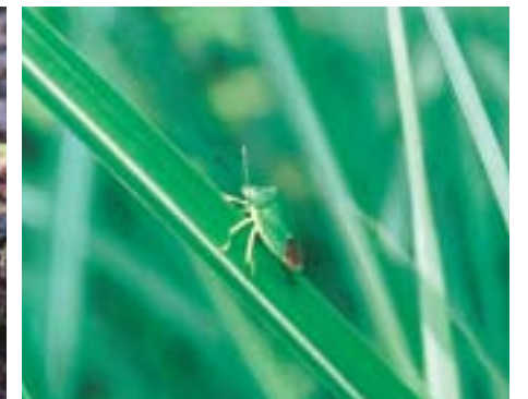
若々しいエゾアオカメムシ