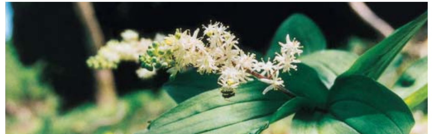
ユキザサの花に夢中のフタオビノミハナカミキリ