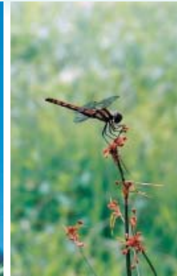
アブラガヤとアキアカネ