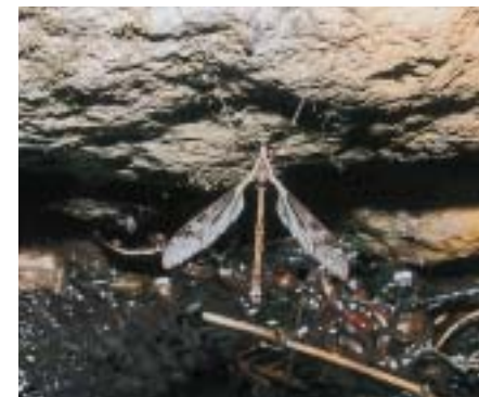
雌を待つマダラガガンボ