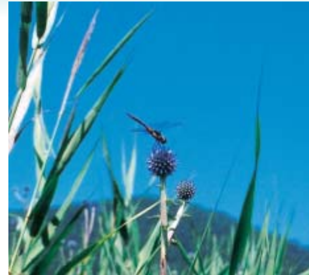
ヒゴタイとアキアカネ

昆虫類は種数、個体数とも全体に少なく、高原特有の種は見られませんでした。また、高原の普通種ギンイチモンジセセリは見られず、ウラギンヒョウモンも少ない。チョウ類の減少は密源となる花の減少など、生息環境の悪化が関係し、この地域から姿を消したミヤマアカネの減少には火山ガスの影響が考えられます。