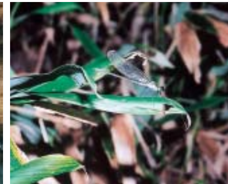
ミヤコザサに憩うカワトンボ