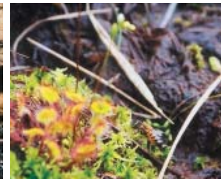
モウセンゴケと吸水中のセイヨウミツバチ