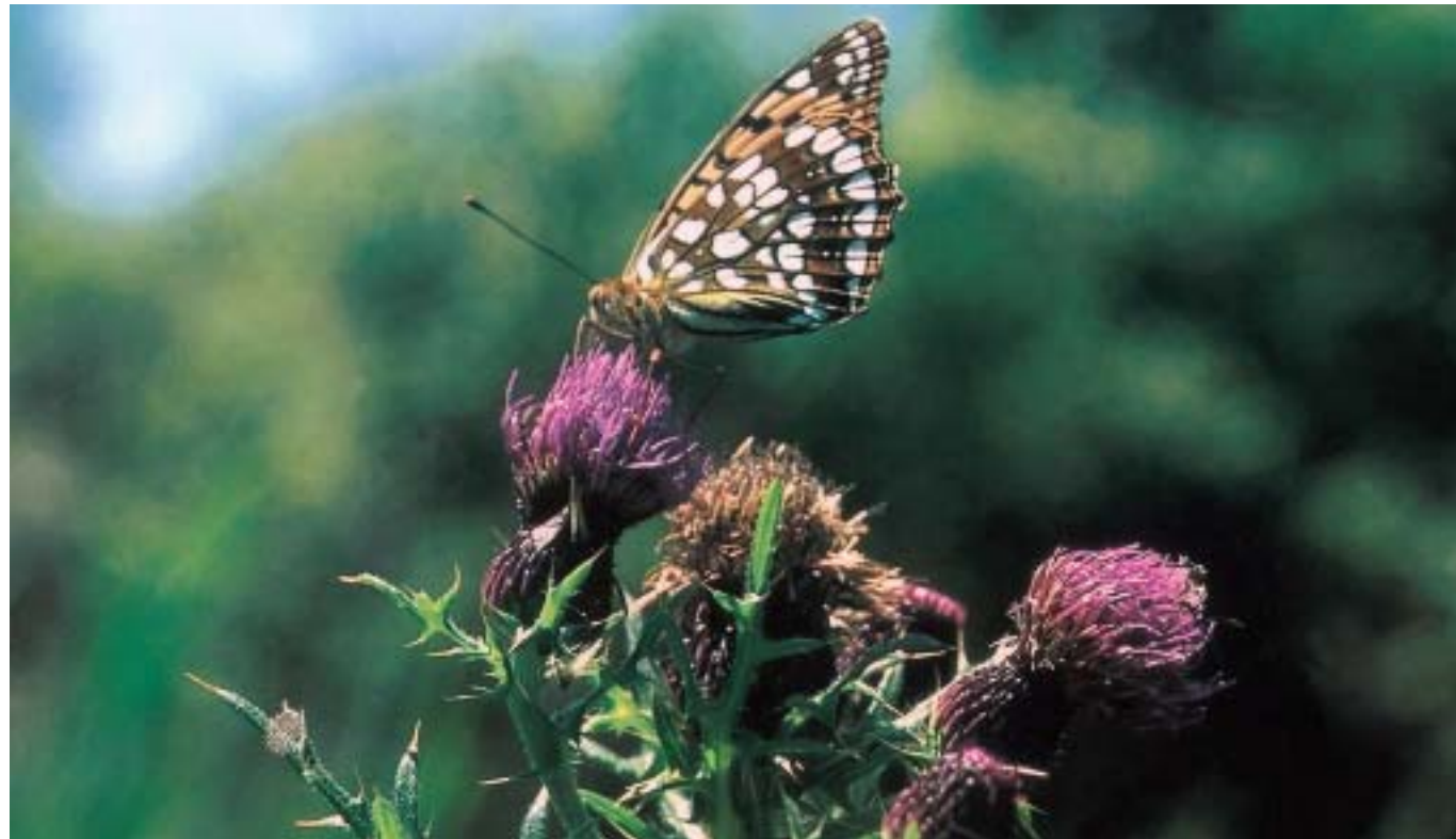
吸蜜中のウラギンヒョウモン

かつて、飯田高原には九州では阿蘇くじゅう火山性草原に特有のチョウがいました。その内オオルリシジミやヒメシジミが姿を消して久しく、最近ではゴマシジミ、ヒメシロチョウの姿も見かけなくなりました。タデ原は1980年代に牧草地となり、ワレモコウやツルフジバカマなど多くの植物を失い、また、水脈を山際で断たれて乾燥しています。昆虫類はこの自然環境の変化と火山ガスの影響で打撃を受けました。この地域の昆虫相は以前に比べて質量的にかなり悪化していますが、この現象は今後さらに急速に進行するものと思われます。