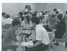
【オリエンテーション】