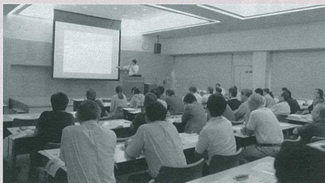
8月19日に行われた事業説明会の様子