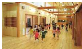
幼稚園、小中学校等の内装木質化