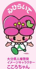
大分県人権啓発 イメージキャラクター こころちゃん

小さな小さな命が、この世界で大きく育つよう、みんなで応援する、そんな社会を作りましょう。