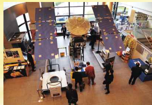
見学者で賑わう展示室