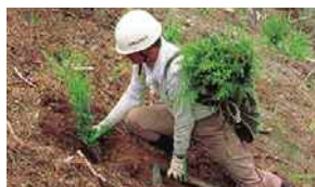
林業適地における低コスト再造林の推進