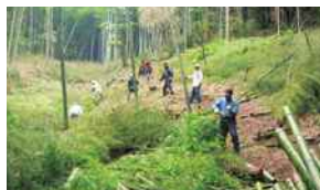
森林ボランティア活動への支援