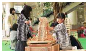
森林環境教育・木育の推進