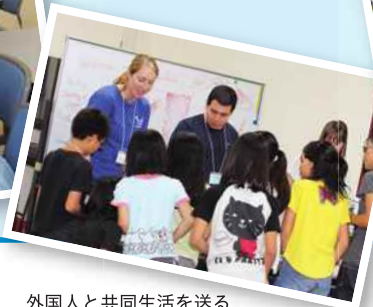
外国人と共同生活を送る小中学生のイングリッシュキャンプ