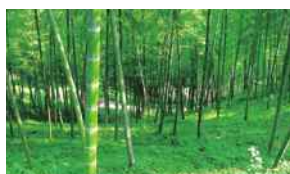
荒廃した竹林の整備