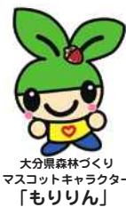
大分県森林づくりマスコットキャラクター「もりりん」