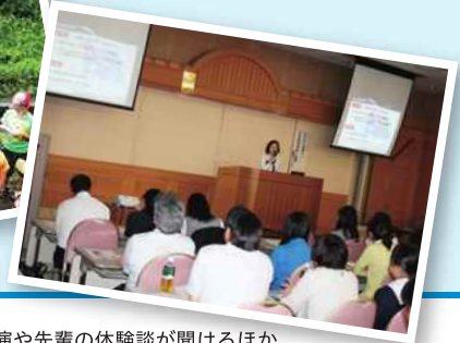
講演や先輩の体験談が聞けるほか、個別相談などを行う留学フェア