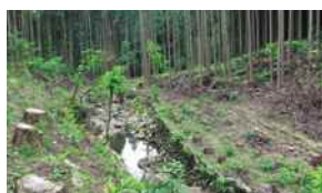
流木発生を未然に防ぐ河川沿いの人工林整備