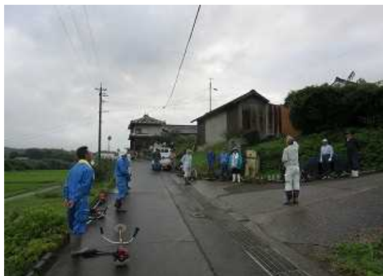
作業前のあいさつ、作業内容確認