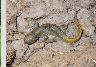
オオイタサンショウウオ