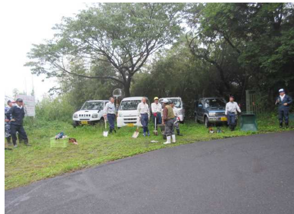
作業前のあいさつ、作業内容の確認