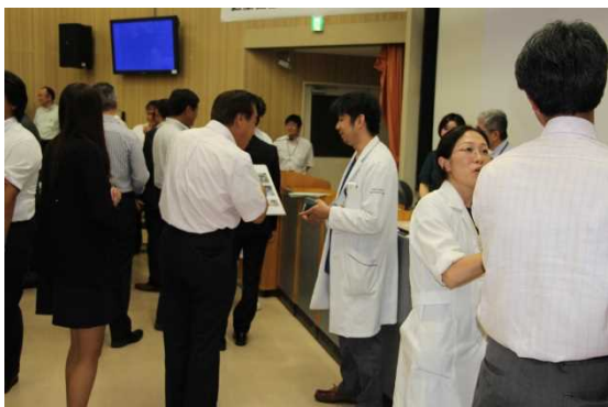
交流会（名刺交換会）