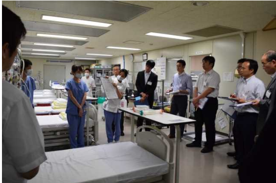
施設見学会（ME 機器センター）

また併せて、医療現場のシミュレーション教育を行う施設「スキルスラボセンター」の施設見学会も行われ、医療関係者による解説や実演を通じて基本的な診察、処置、治療のトレーニングの様子を体験見学しました。