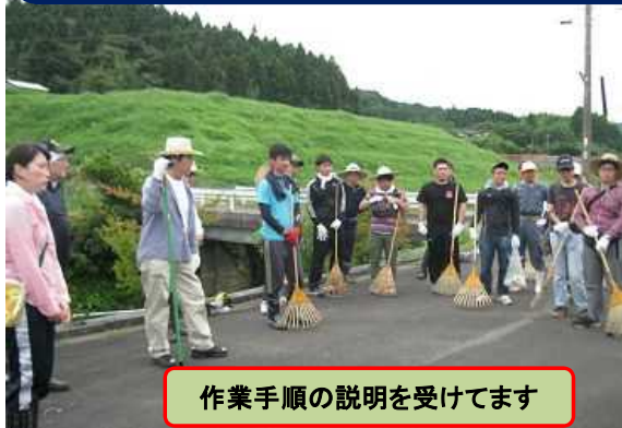
作業手順の説明を受けてます