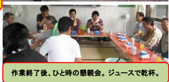
作業終了後、ひと時の懇親会。ジュースで乾杯。