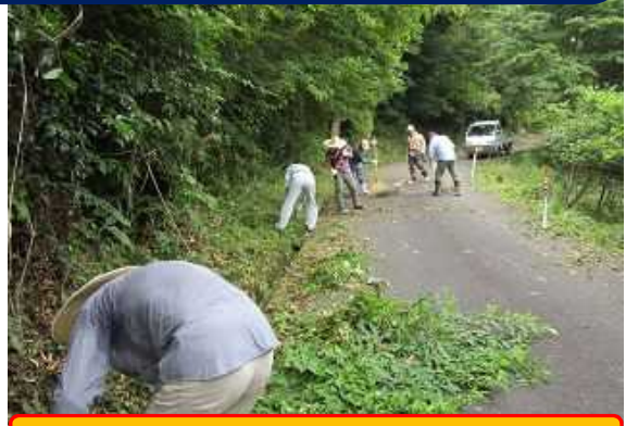
ふた手に分れて作業開始！