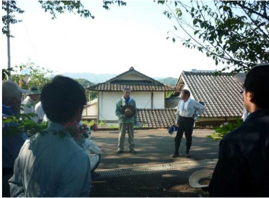
作業前のあいさつ、作業内容の確認