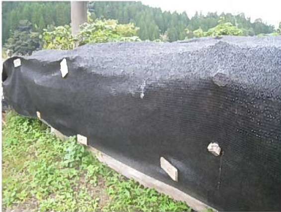
直接ほだ木全体を遮光ネットで包み込んだ悪い事例