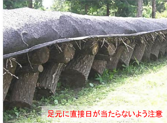
足元に直接日が当たらないよう注意