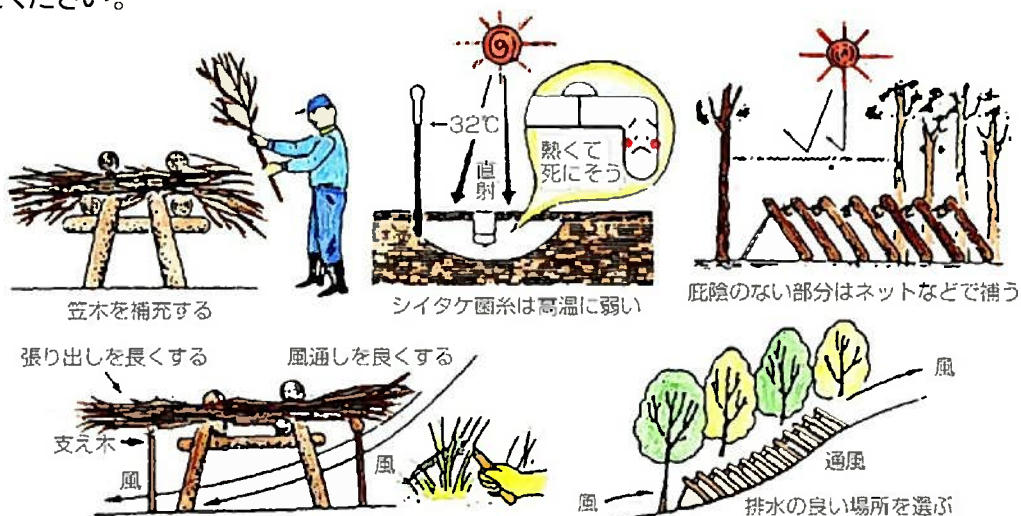
図. 本伏せ後の管理と対策

高温障害を避けるため、笠木の点検・補充を行ってください。ほだ木がちらちら見える程度になるまでかけましょう。ほだ木の小口がよく見える場合には、両端の笠木を補充しましょう。特に、西日が当たらないように注意してください。