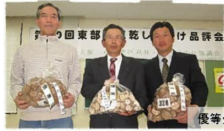
優等受賞の皆さん