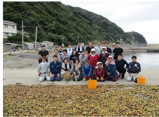
作業終了後、地域の方との記念撮影