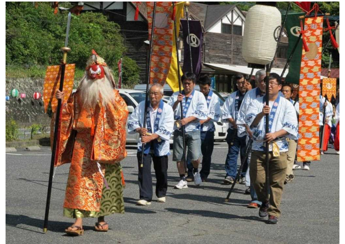
御輿行列への参加