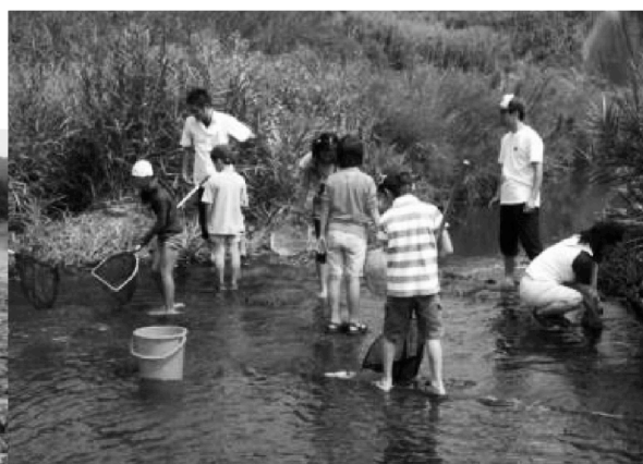
（平成20年度実施箇所 丹生川、田ノ浦海岸）