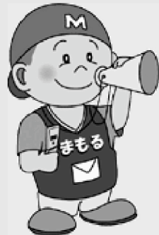
大分県警察防犯キャラクター「まもるくん」▶