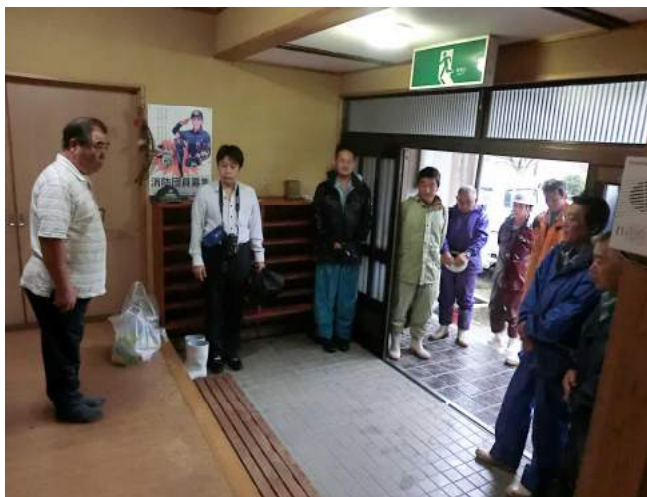
上深水自治区 諫山自治委員よりお礼の挨拶