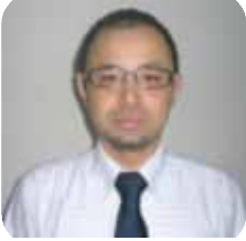
【執筆】 社会保険労務士 轟 憲人 (轟社会保険 労務士事務所)