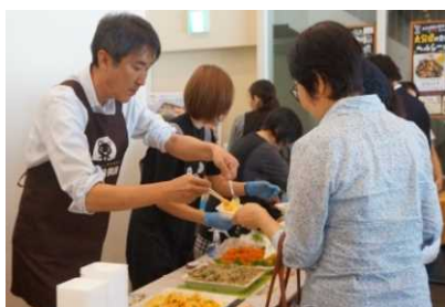
うま塩 (減塩) 試食