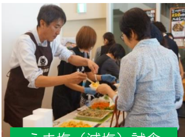
うま塩 (減塩) 試食