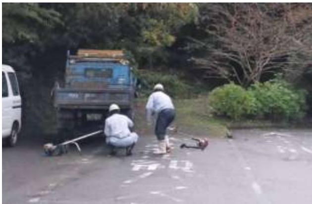
住民と応援隊の共同作業