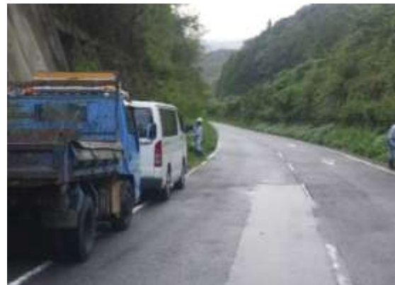
住民と応援隊の共同作業