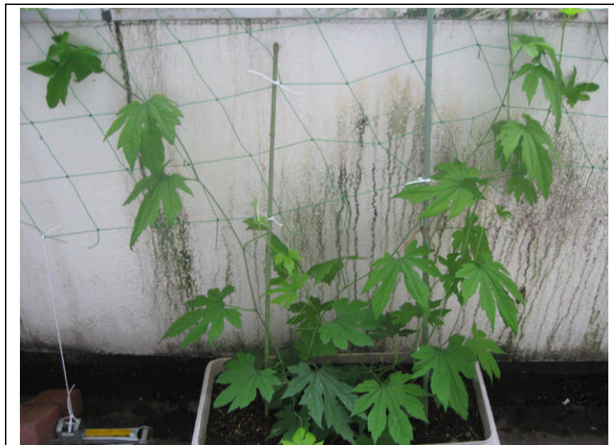
支柱を伝って網の方へ広がっている様子