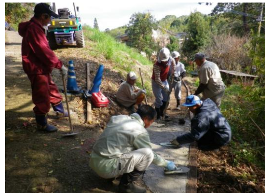
住民と応援隊の共同作業