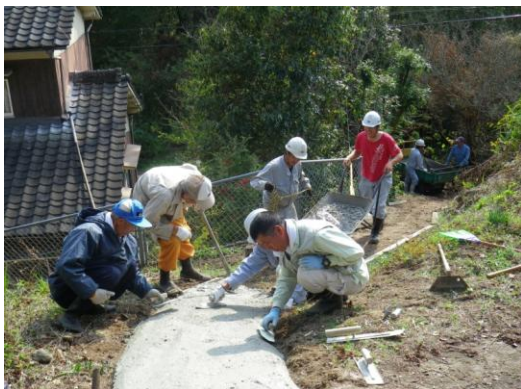
住民と応援隊の共同作業