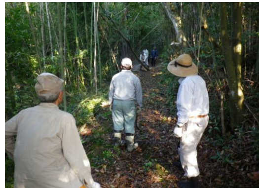
住民による伐採（事前準備）