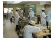
クッキーづくりの様子