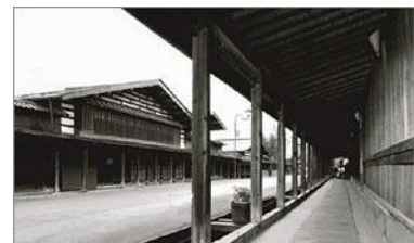
せっかく綺麗にしたのに、人がいないよ