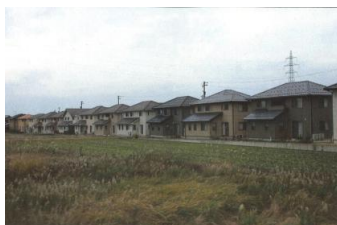
揃ってればいいの？