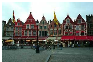
明るい色でもきれいだけどなあ