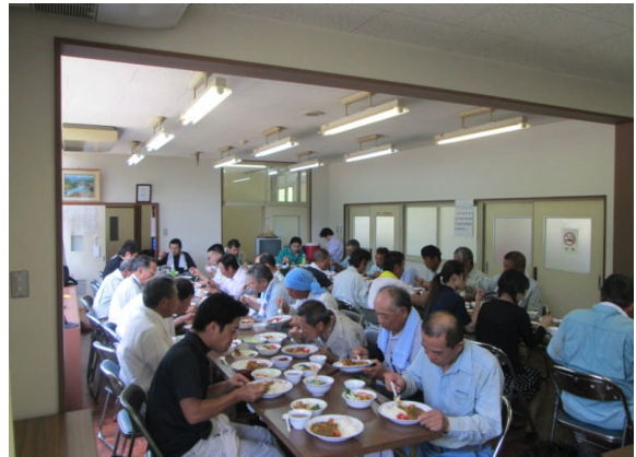
作業終了後の昼食会