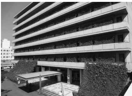
春「エコ花ライフ」～緑のカーテン（大分市）

春にはアサガオやヘチマ等のツル性植物で窓際や壁面に「緑のカーテン」を育てる『エコ「花」ライフ』、夏には風呂の残り湯などの二次利用水を使って「打ち水」を行う『エコ「涼」ライフ』、秋には食材の使い切りや省エネ調理法などの「エコ・クッキング」に取り組む『エコ「食」ライフ』、冬には重ね着等により暖房の設定温度を抑制する『エコ「暖」ライフ』の実践を呼びかけている。