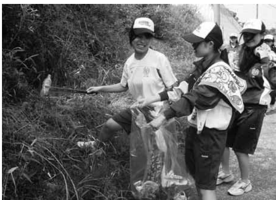
120万人県民一斉ごみゼロ大行動（杵築市）