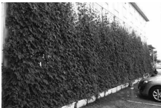
緑のカーテン応募写真（大分市立大東中学校）

また、「緑のカーテンフォトコンテスト」を実施し、家庭、学校、事業所から、43件の応募があり、最優秀賞1点、部門賞3点、特別賞6点を選出した。