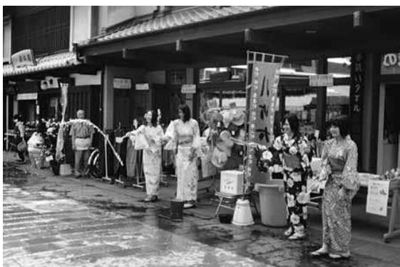
夏「エコ涼ライフ」～打ち水（臼杵市）