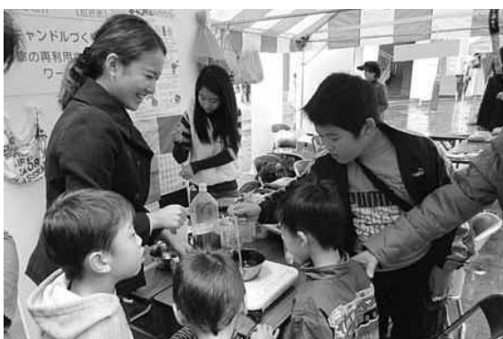
ごみゼロおおいたエコライフフェア

また、ごみゼロおおいた推進隊の活動を広く県民に広報するため、平成23年度と平成24年度にごみゼロおおいたエコライフフェアを、平成25年度にはごみゼロフェスティバルを開催した。（平成25年度任命ごみゼロおおいた推進隊名簿は表1-1a）