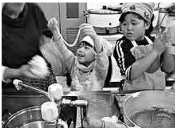
秋「エコ食ライフ」～エコ・クッキング（大分市）