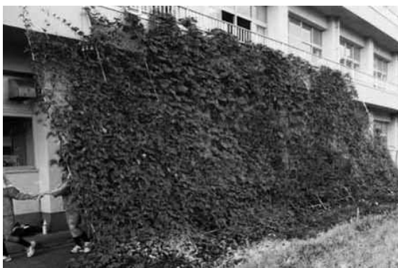
緑のカーテン応募写真（豊後大野市立千歳中学校）