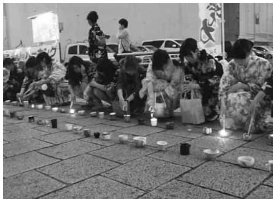
「府内学生エコフェスタ」(大分市)

こうした活動をさらに浸透させ、県民総参加により美しく快適な大分県づくりを進めるため、平成15年9月には「ごみゼロおおいた作戦県民会議」を新たに設置し、環境の世紀と言われる21世紀にふさわしい、安心して心豊かに暮らせる大分県づくりに取り組んでいる。