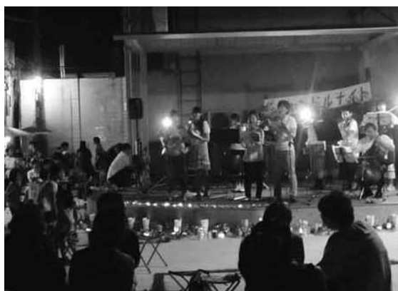
「夜空の向こうへ響け! しゃらかな音楽会」(佐伯市)