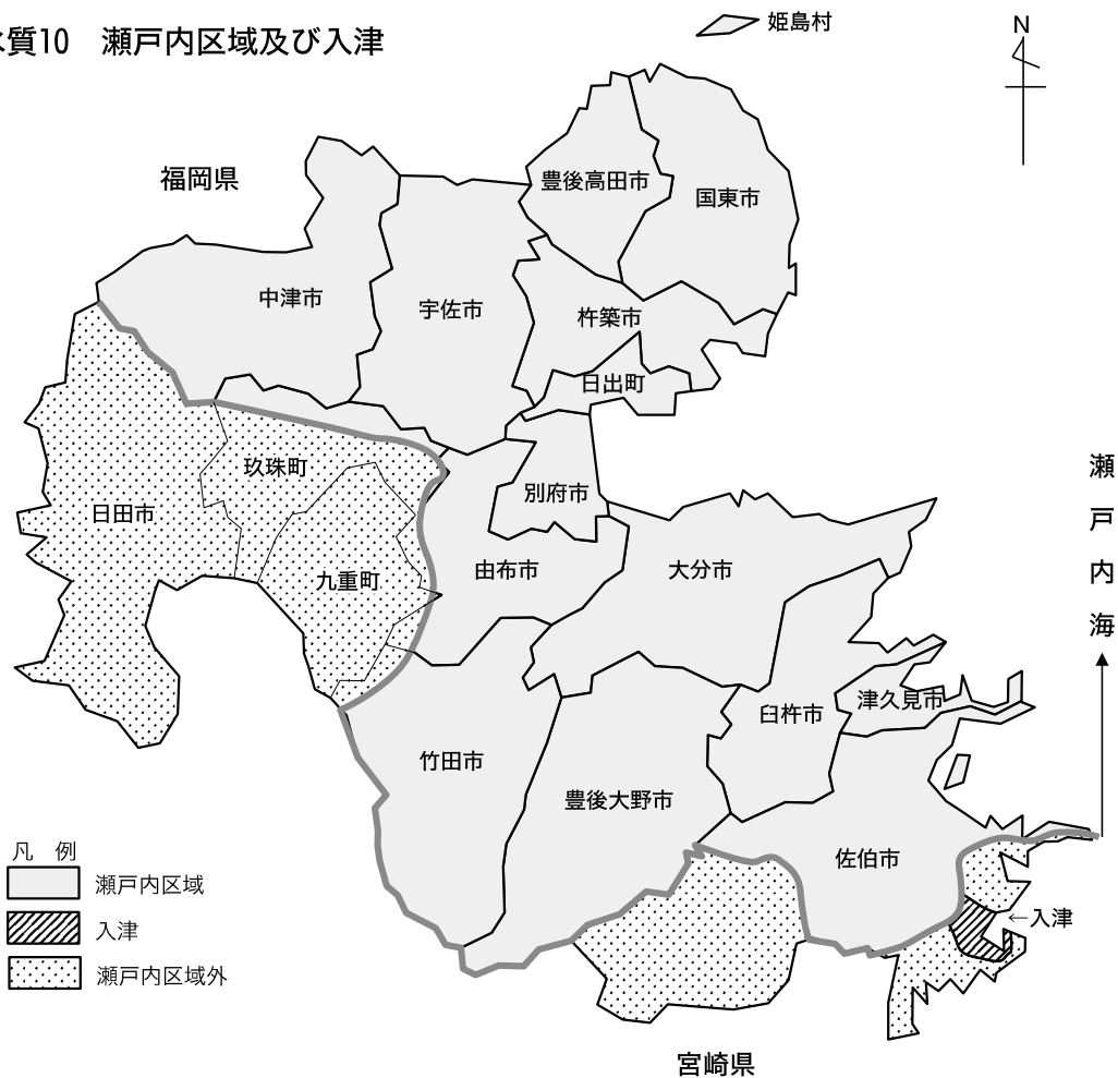
図 水質10 瀬戸内区域及び入津