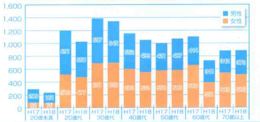
契約当事者の年代別・年度別・性別苦情相談件数