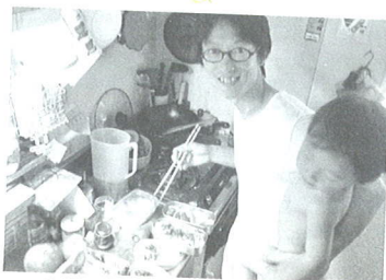
朝ごはんとお弁当作り