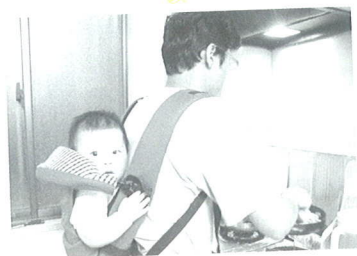
ママ早く帰ってきて!!