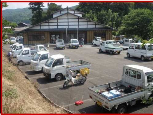
伝承館に集結した頼もしい応援隊車両