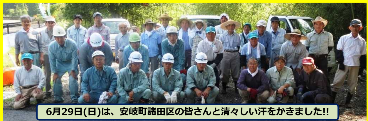
6月29日(日)は、安岐町諸田区の皆さんと清々しい汗をかきました!!