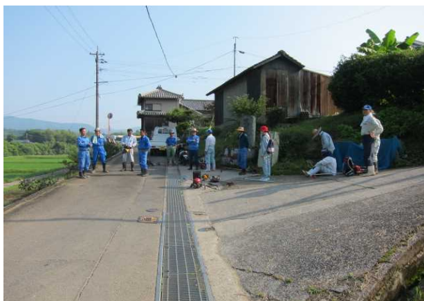
作業前打ち合わせ