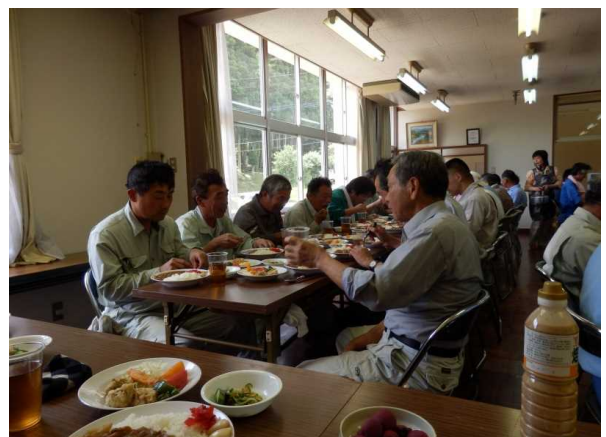
作業終了後の昼食会