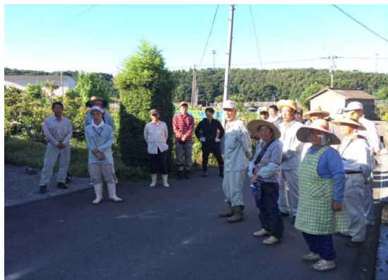
対面式・共同作業