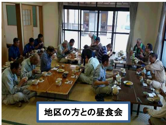
地区の方との昼食会