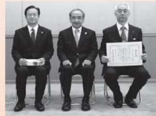
社会福祉法人 みのり村(杵築市)

各事業者の取組の詳細は、大分県庁HPでご覧になれます! http://www.pref.oita.jp/soshiki/13100/jigyousyakennsyou25.html