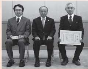
社会医療法人財団 天心堂(大分市)