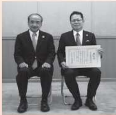
株式会社永富調剤薬局(大分市)

大分県では、男女共同参画社会づくりに関する県民と事業者の関心と意欲を高めるため、働く場における男女共同参画の推進に積極的に取り組まれている事業者を顕彰しています。