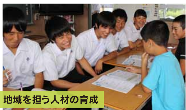
地域を担う人材の育成

地域の高校では、「生徒が行きたい学校、生徒に選ばれる学校」を目指して、地域と連携した魅力・特色ある学校づくりを進めています。学校の中だけでなく、積極的に地域に出向き、地域の方々と協力して楽しく学び、自分の成長にもつながる魅力的な取組が行われています。