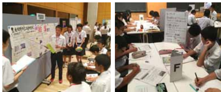
「学び向かう学校」づくり中核校生徒連絡協議会の様子

詳しい内容については県教育委員会ホームページをご覧ください。 平成28年度 全国学力調査結果 大分県教委 検索