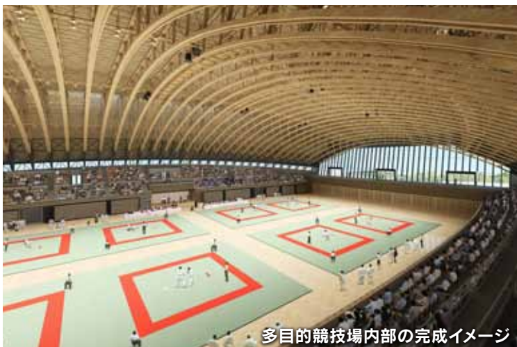
多目的競技場内部の完成イメージ (実施設計時)

問 屋内スポーツ施設建設推進室 TEL 097-506-5649 屋内スポーツ施設 大分県 検索