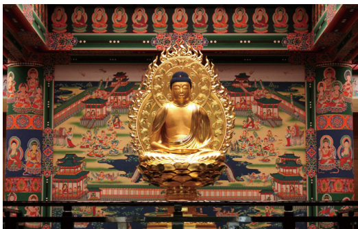
富貴寺大堂復元模型

富貴寺大堂壁画外陣北小壁断片 富貴寺大堂壁画現状模写 富貴寺大堂壁画復元模写(パネル展示)