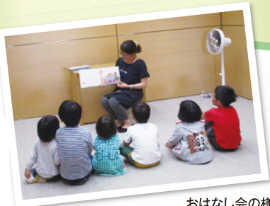
おはなし会の様子

ペンちゃんFBでもおはなし会や図書館の情報をお知らせしています。ぜひチェックしてください!