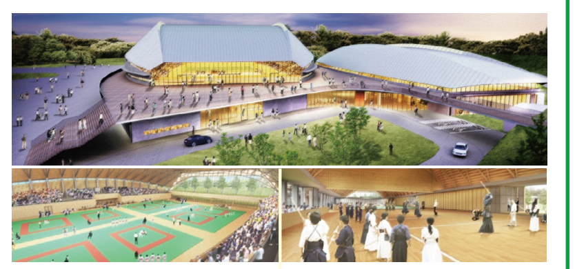
基本設計時点のイメージです