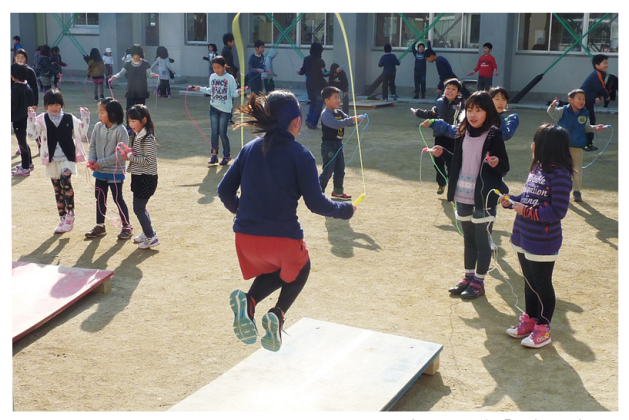
高田小学校「一校一実践」