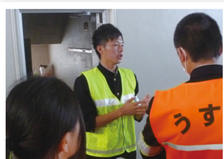
写真③避難所運営訓練