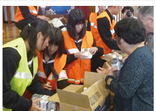
写真④避難所運営訓練