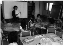
宇佐市西馬城小学びの教室

現在、小学校1年生から中学校3年生までの約1600人が参加し、地域の方と一緒に学校の宿題や学習プリントを使って熱心に学習しています。