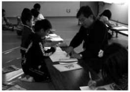
中津市如水小学びの教室

詳しくは実施市町村教育委員会 または大分県教育庁社会教育課生涯学習推進班 TEL 097-506-5526 にお問い合わせ下さい。