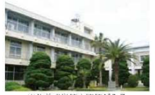
宇佐養護学校中津校が入る中津商業高等学校校舎

中津東高等学校の開校に伴い、22年度末で利用しなくなる中津商業高等学校校舎の空教室を随時改修・利用して、21年度に小学部を、22年度に中学部を、23年度に高等部を、3年計画で開設していきます。 中津校が開校されることで、中津市在住の児童生徒の長時間通学が解消できるとともに、宇佐養護学校本校における、教室不足等の解消が期待できます。 平成22年度までは、中津商業高等学校の生徒が在籍しておりますので、2年間、一緒の校舎で学習することになります。