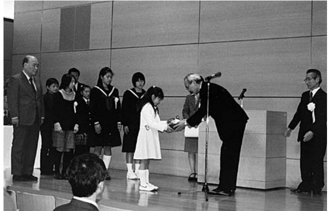
昨年度の表彰式の様子