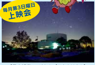
【星空観察・デジタルプラネタリウム】