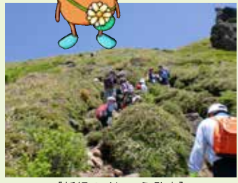
【新緑のくじゅう登山】