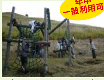
【フィールド アスレチックコース】