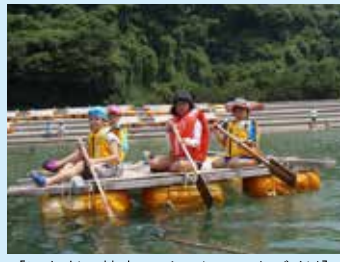
【いかだで協力 チームワークづくり】