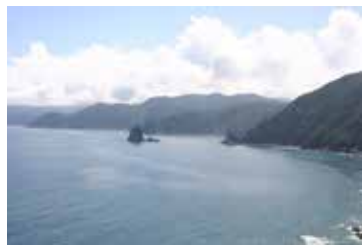
豊後水道の海岸(佐伯市米水津)

平成28年4月の熊本・大分地震は、改めて地震の恐ろしさを知る契機となりました。今回の講座は、大分県に大きな被害をもたらす可能性のある南海トラフの地震発生のメカニズムや、宝永地震(1707年)をはじめとする過去の被害状況などを紹介するものです。過去を知ることは命を守ることに繋がります。講座を通して、地震と津波への防災・減災の意識を深めていただければと考えます。