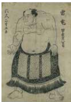
史上最強の力士と言われる「雷電」

※この観覧料で平常展の観覧も可能 ※中学生以下および土曜日の高校生の観覧は無料 ※身体障害者手帳・療育手帳・精神障害者保健福祉手帳のいずれかをお持ちの方とその付添の方1名は無料