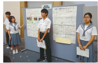
由布市立湯布院中学校の実践発表

中学校では、「『学びに向かう学校』づくり」により、学習意欲や粘り強さ、友だちと協働する力などをぐくむとともに、「3つの提言」により、教科や学年のわくをこえた学校の組織的な授業改善に取り組んでいます。