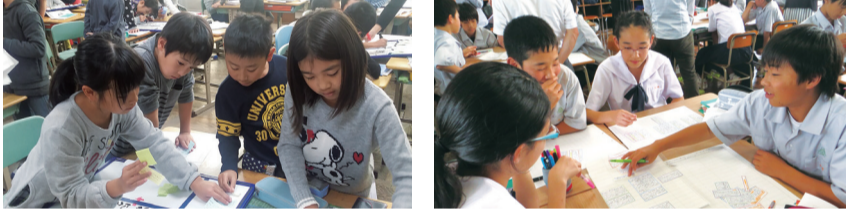
新大分スタンダードによる小・中学校の授業風景