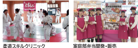
柔道スキルクリニック 家庭部弁当開発・販売

このプロジェクトには、計16校が参加しています。各学校のプロジェクトの概要や取組内容については、県教育委員会や各学校のホームページでご覧いただけます。