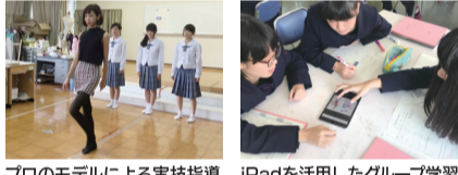
プロのモデルによる実技指導 iPadを活用したグループ学習