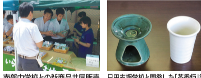
南部中学校との新商品共同販売 日田支援学校と開発した「茶香炉」等