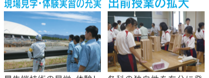
現場見学・体験実習の充実 出前授業の拡大 最先端技術の見学・体験! 各科の独自性を存分に発 地域密着型防災で命守る! 揮って、子どもたちに夢を! 開かれた学校として、地元「林工」をアピール! →地域に活力! 将来のマイスター発掘!