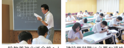
一般教養強化で合格へ! 建設業就職に必要な資格取得、教員指導力アップ 公務員合格率UP!! 資格取得大分No.1へ