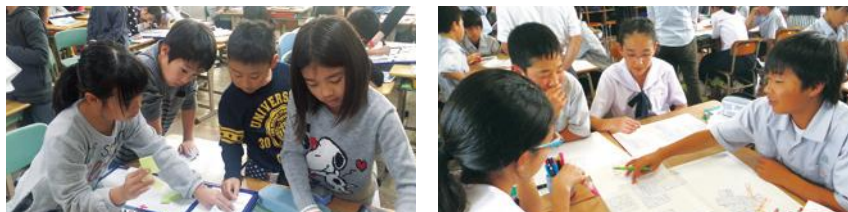
新大分スタンダードによる小・中学校の授業風景

問題解決的な展開の授業 自分の考えをもち、それを表現したり、 交流活動で深めたりする授業