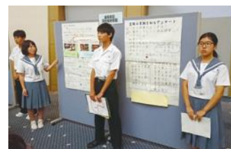
由布市立湯布院中学校の実践発表

中学校では、「『学びに向かう学校』づくり」により、学習意欲や粘り強さ、友だちと協働する力などをはぐむとともに、「3つの提言」により、教科や学年のわくをこえた学校の組織的な授業改善に取り組んでいます。