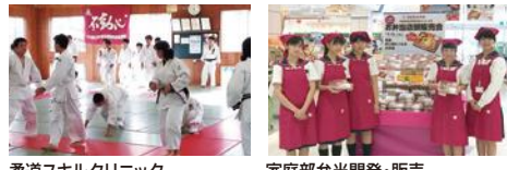
柔道スキルクリニック 家庭部弁当開発・販売

このプロジェクトには、計16校が参加しています。各学校のプロジェクトの概要や取組内容については、県教育委員会や各学校のホームページでご覧いただけます。