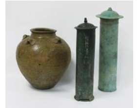
みやこ町下田経塚出土遺物(個人蔵)