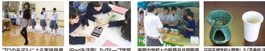
プロのモデルによる実技指導 iPadを活用したグループ学習 南部中学校との新商品共同販売 日田支援学校と開発した「茶香炉」等