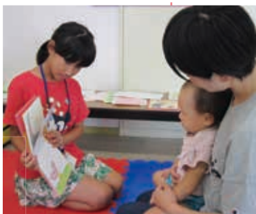
乳児と絵本でブックスタート

1年間、図書館の仕事や本の紹介のしかたを学んだ「子ども司書」1期生・2期生(計171名)が、県内各地で活躍しています!