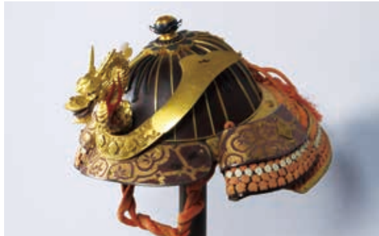
白杵藩稲葉家重具足

■会 期／平成30年3月16日(金)～5月13日(日) ■会 場／県立歴史博物館 第2企画展示室 ■観 覧 料／[個人]一般310円 高・大学生150円 [団体]一般200円 高・大学生100円 中学生以下および高校生の土曜日の観覧は無料です。