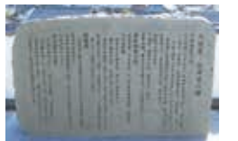
大地震・大津波の碑(佐伯市米水津)江戸時代の地震被害を後世に伝えるために建てられました。