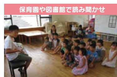
保育園や図書館で読み聞かせ