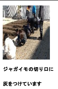
ジャガイモの切り口に灰をつけています

二月七日(水)に菜園活動では「ジャガイモの種イモ植え」を行いました。半分は切ったジャガイモの切り口に灰をつけて土に植えました。これは、ジャガイモの切り口が腐るのを防止するためです。このジャガイモは来年度の野菜販売活動の商品になる予定です。