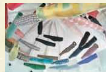
須藤玲子《このほり》 2014年 フランス国立ギメ東洋美術館