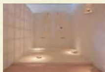
ミヤマケイ《必然》 2013年