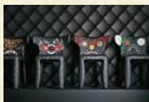
マルセル・ワンダース 《モンスター・チェア》2014年 Courtesy of Marcel Wanders

開館当初より親しまれている アトリウム作品の三作家、マ ルセル・ワンダース、須藤玲 子、ミヤマケイによるアートと デザインの大茶会、それは感 性を刺激する驚きの世界。